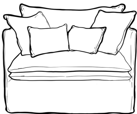
Canapé Mille et une Nuit, longueur 1 m, profondeur 95 cm, hauteur 70 cm, avec accoudoirs, jupe longue